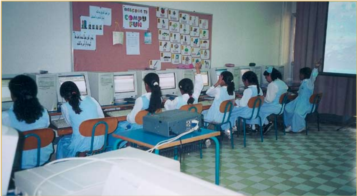
معمل الكمبيوتر في القسم الابتدائي

عندما أصبح من الضروري للطالبة أن تتعلم مبادئ الكمبيوتر بادرت (دار الحنان) في عام ١٤٠٨هـ بتدريس الطالبة منذ المرحلة الابتدائية الحاسب الآلي كمادة إضافية، تقدم من خلال حصتين في الأسبوع.. وأسست المدرسة معمل (صخر) المجهز بأحدث الأجهزة، بالإضافة إلى الطابعات وجهاز العرض الذي تعتمد عليه المعلمة (١) في الشرح بينما بوسع الطالبة أن تطبق الدرس عملياً من خلال استخدام جهاز الكمبيوتر والبرامج الأساسية والتطبيقية.. كما تم الاعتماد على استخدام الحاسب في معامل اللغات لتتقن الطالبات عملية البحث عبر شبكة الإنترنت.. وفيما بعد أدخلت الرئاسة العامة لتعليم البنات الحاسب الآلي رسمياً ضمن برنامجها التعليمي.