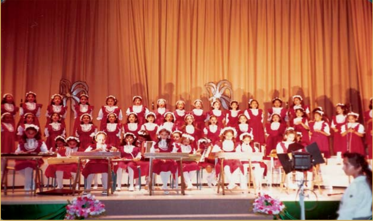
طالبات المرحلة التحضيرية في حفل التخرج