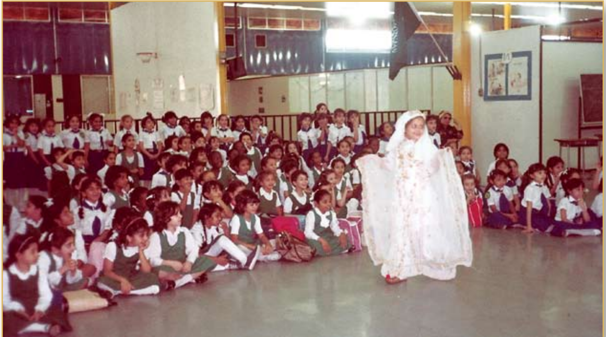
عرض فلكلوري لطالبات المرحلة الابتدائية في صالة المطار

كطالبات لم نكن ينبهنا بأن ذلك المبنى الذي قضينا فيه سنوات هو مبنى للمطار سوى (سير حقائب المسافرين)، اختلف المكان غير أن كل شيء في الحياة المدرسية ظل كما هو بما فيه الأنشطة اللامنهجية، والمباريات الرياضية، حيث تم تركيب شبكة للكرة الطائرة في إحدى الساحات، وتعليق سلتين لكرة السلة في أخرى، مع استغلال الساحات الكبيرة لإقامة الفعاليات الكشفية وغيرها.