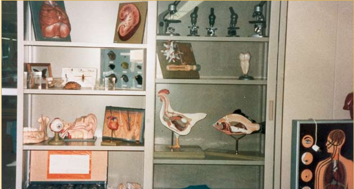
معمل الأحياء في القسم المتوسط والثانوي

أمّا اللغة الفرنسية فتعدّ الطالبات بعد إتقانها أيضاً لعدة شهادات من مستويات مختلفة حتى تصل كما في اللغة الإنجليزية