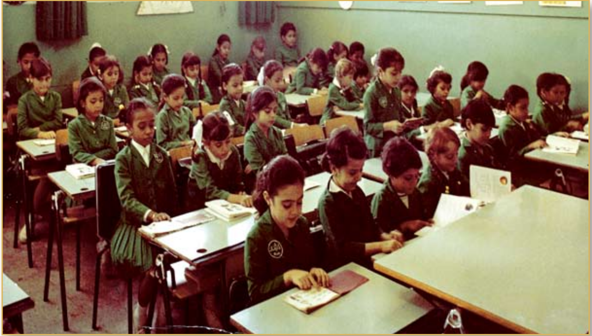
طالبات المرحلة الابتدائية ١٣٨٦هـ