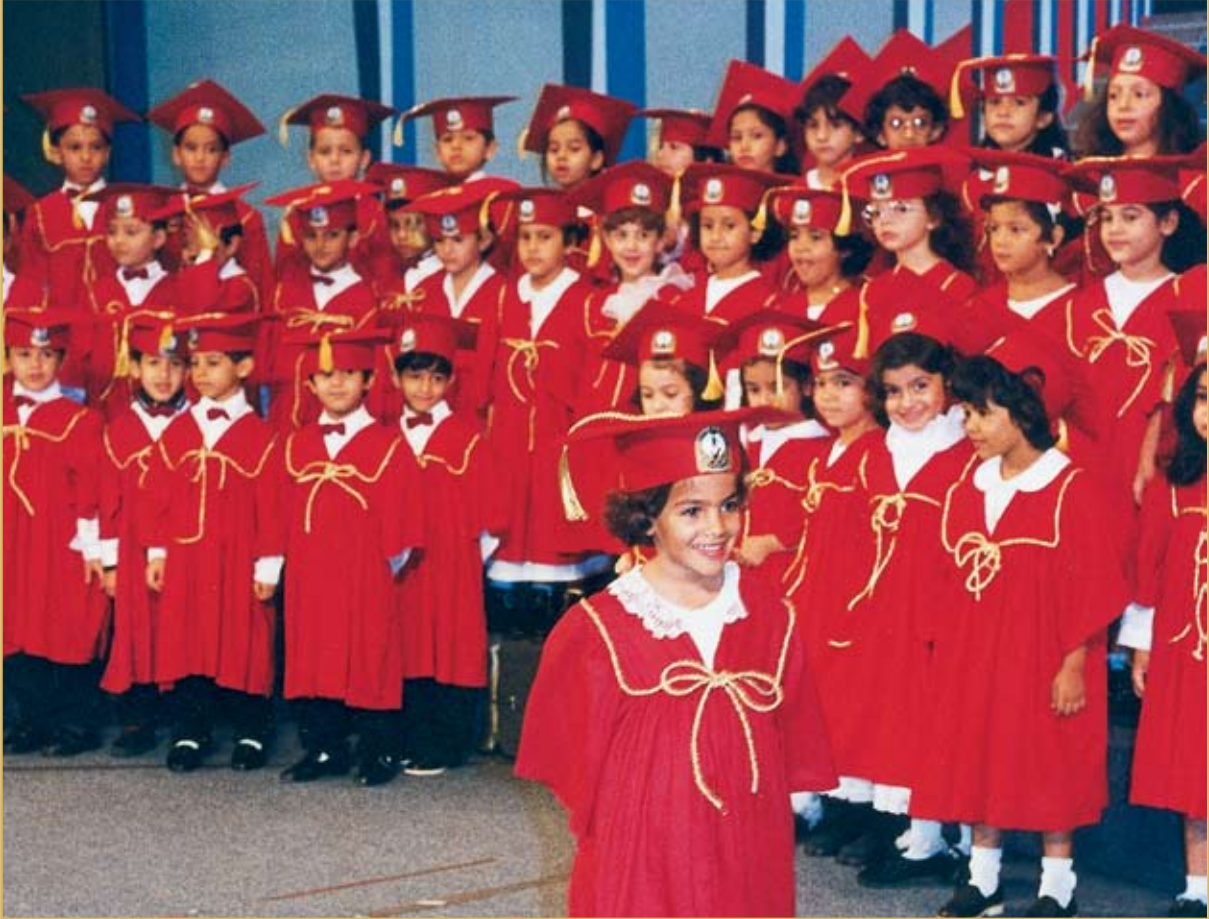
طالبات المرحلة التحضيرية في حفل التخرج

أن تلفظها. وما لبثت أن أدركت الخطأ اللغوي، وكررت وراء معلمتي النطق بالفصحى وبالتشكيل. وكدت أن أوصل إلقاء الكلمة لولا أن (أبله سيسيل) استوقفتني مجدداً قائلة: