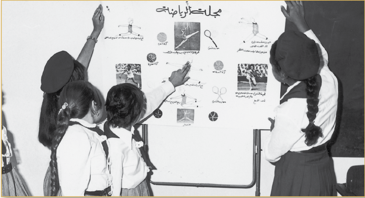
زهرات دار الحنان

وخلقياً واجتماعياً. كما وأنها تنمي فيها المواهب والقدرات منذ الصغر» (١) .