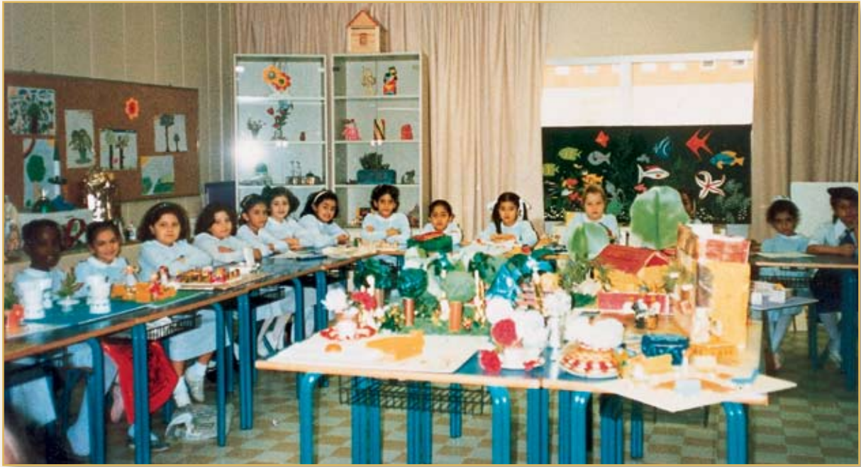
مجسمات من عمل طالبات المرحلة الابتدائية