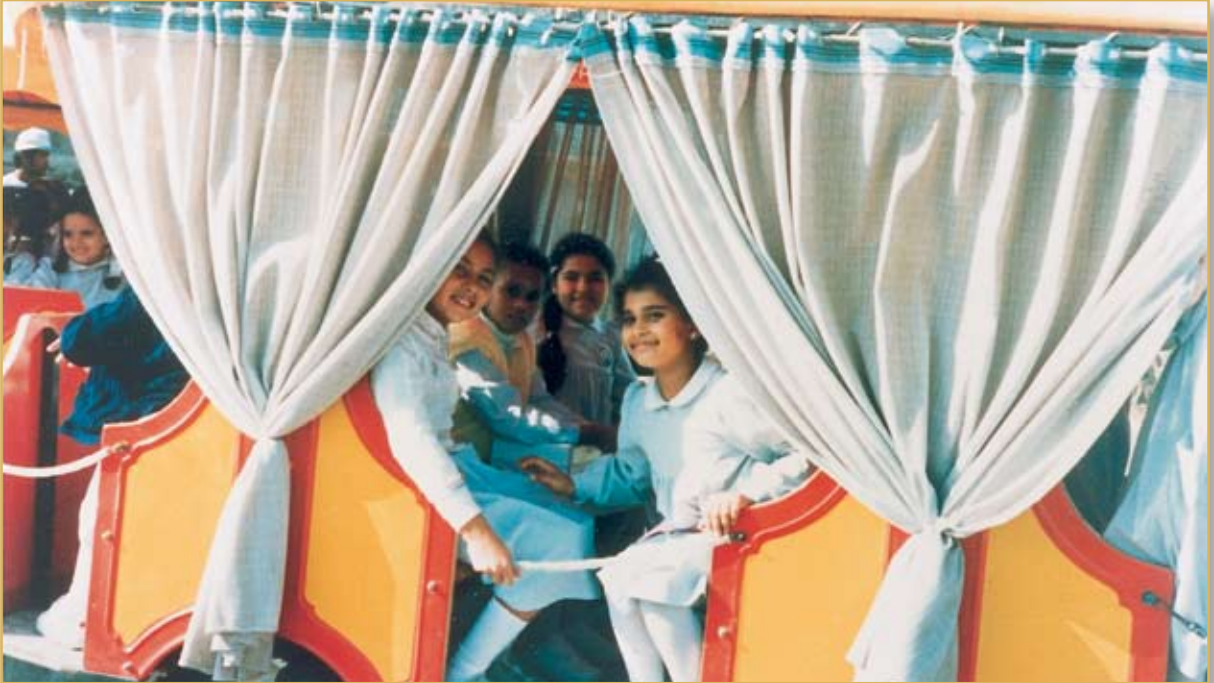
طالبات المرحلة الابتدائية في زيارة ميدانية