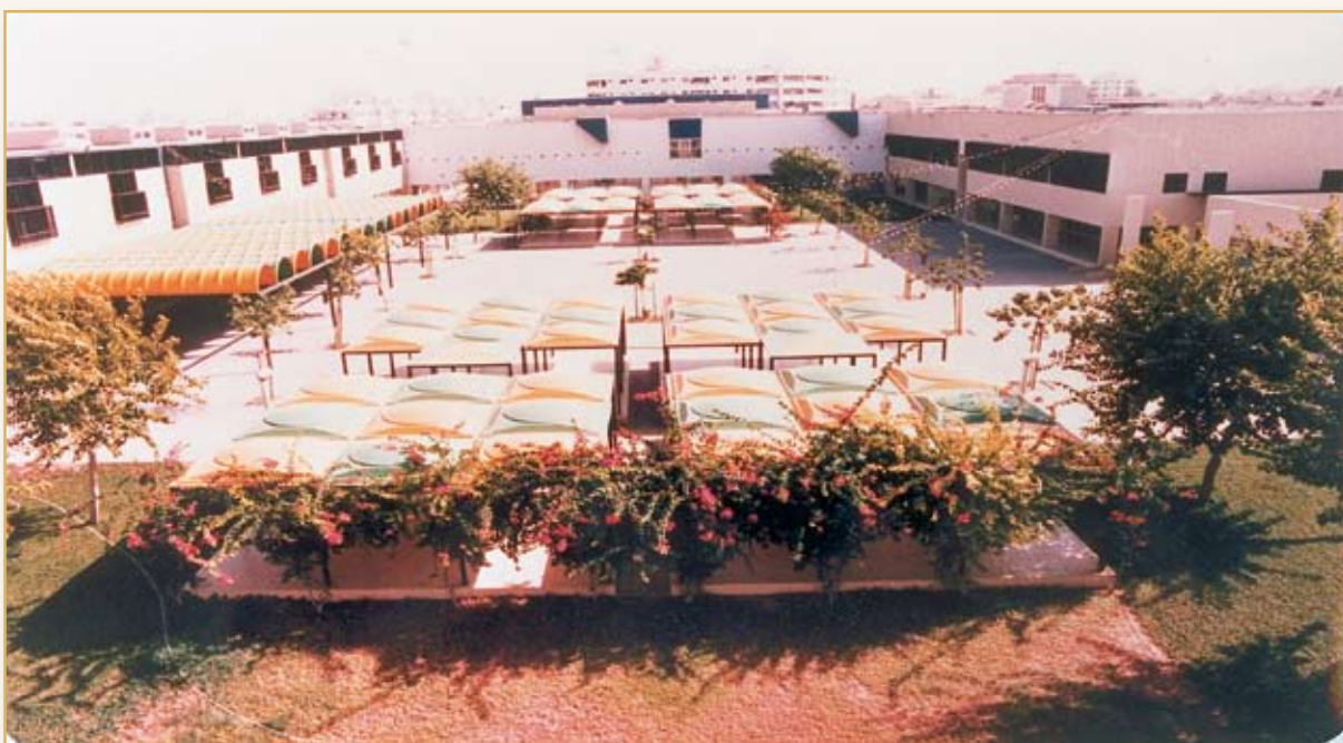
صورة لمبنى المدرسة بجوار قصر خزام