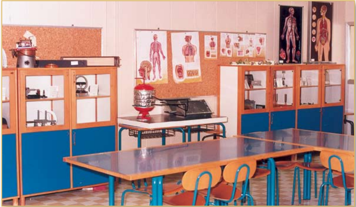
معامل العلوم في القسم الابتدائي