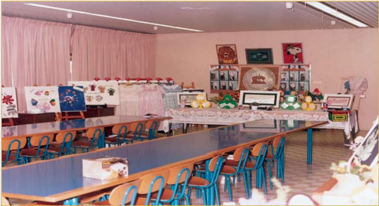
قاعة التفصيل والخياطة