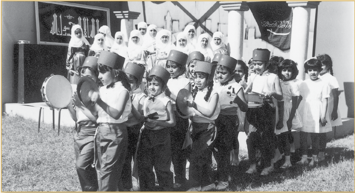
حفل للقسم الابتدائي تم تصويره تلفزيونياً لبرنامج (بابا أمين) عام ١٣٨٩هـ/ ١٩٦٩م