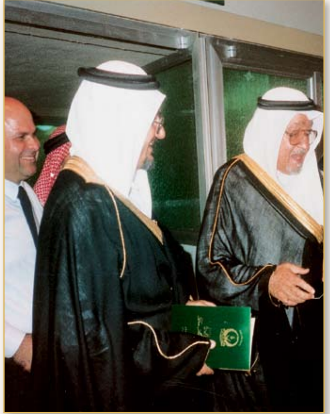
الأمير عبد الله الفيصل - يرحمه الله - والأمير تركي الفيصل في افتتاح مبنى دار الحنان