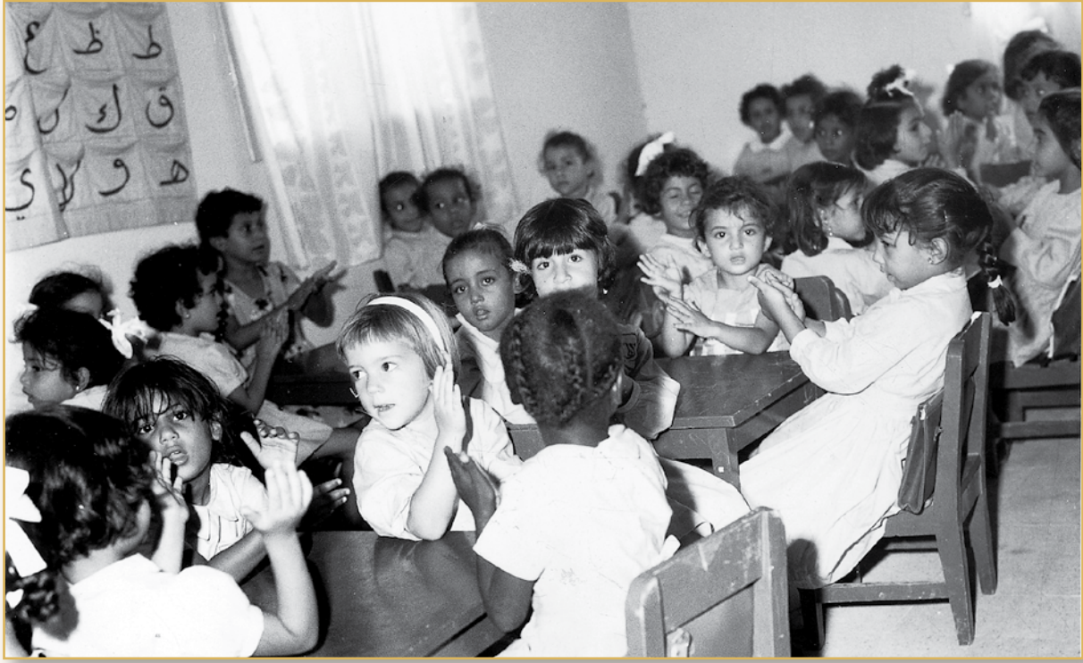
صف دراسي ١٣٨٣هـ

المعارف الإشراف الفني عليها، وتم افتتاح أول روضة حكومية في عام ١٣٨٦هـ بمدينة الرياض، كما افتتحت الرئاسة العامة لتعليم البنات أول (روضة) في مكة المكرمة عام ١٣٩٥هـ. (١)