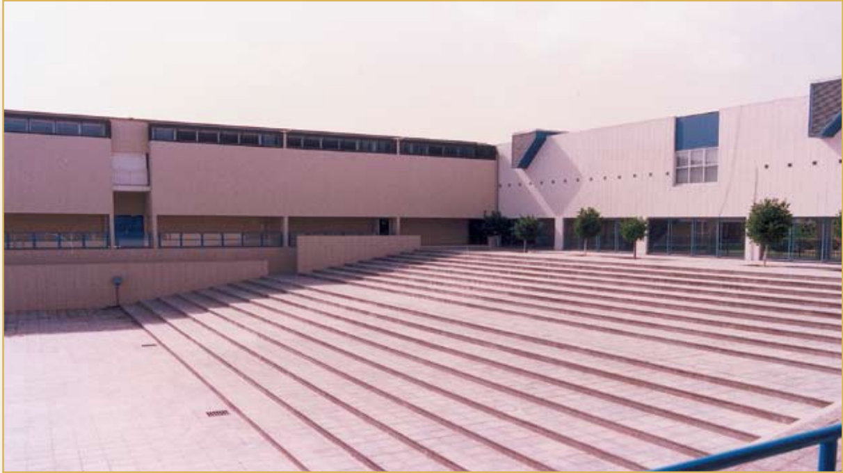
مدرجات المسرح المكشوف

رعشة غريبة من نبرة صوتي إلى يدي التي تمسك بأوراق القصيدة، ولازمتني حتى غادرت خشبة المسرح، وسؤال واحد يحاصرني: كيف لطالبات (دار الحنان) من المرحلة التحضيرية إلى التوجيهية أن يقفن بهذه الثقة والثبات لتقديم فقرات الحفل أمام الحشد الكبير من الحضور دون أن تهتز إحداهن من رهبة المسرح؟».