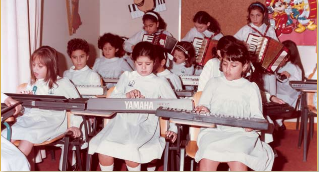
الطالبات في حصة الموسيقى

بالإضافة إلى التركيز على مادة الإنشاء والتعبير التي كانت تُقام فيها مسابقات دورية بين الطالبات على مستوى الفصول والمراحل الدراسية.