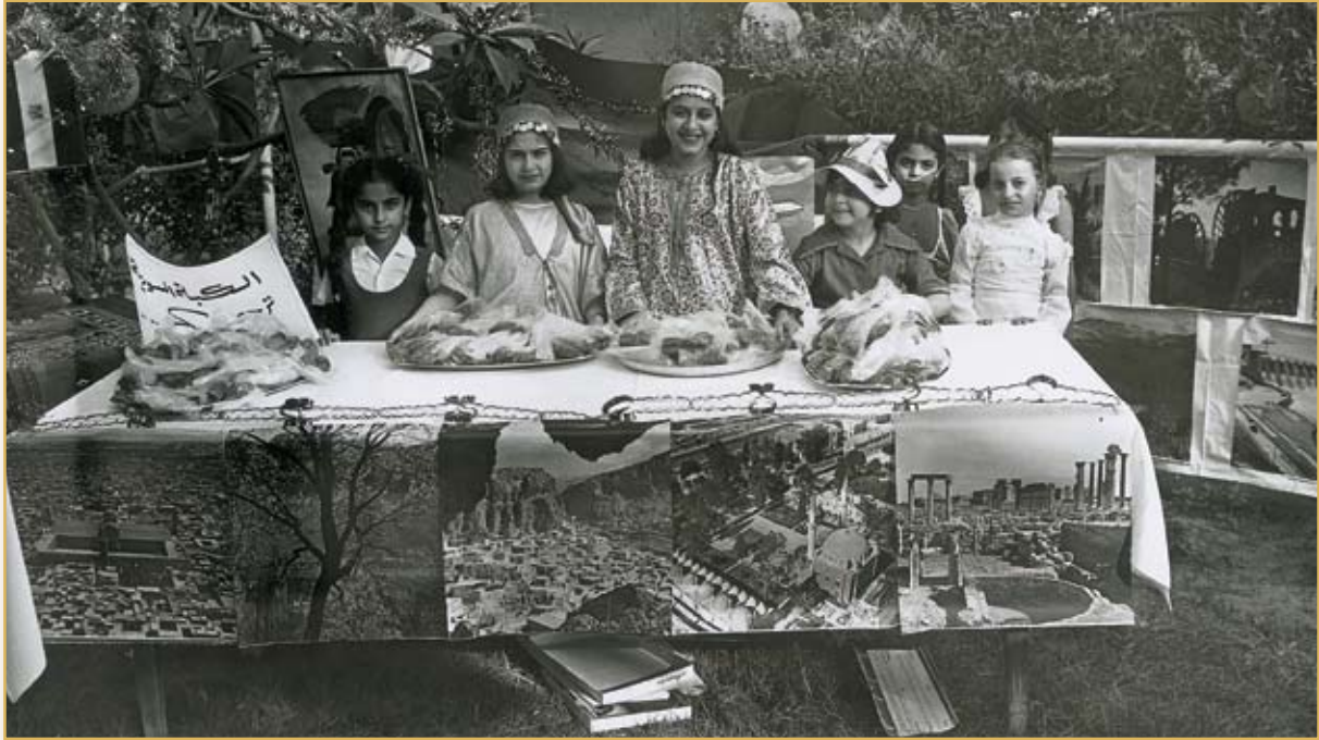
طالبات دار الحنان في أحد بازاراتها