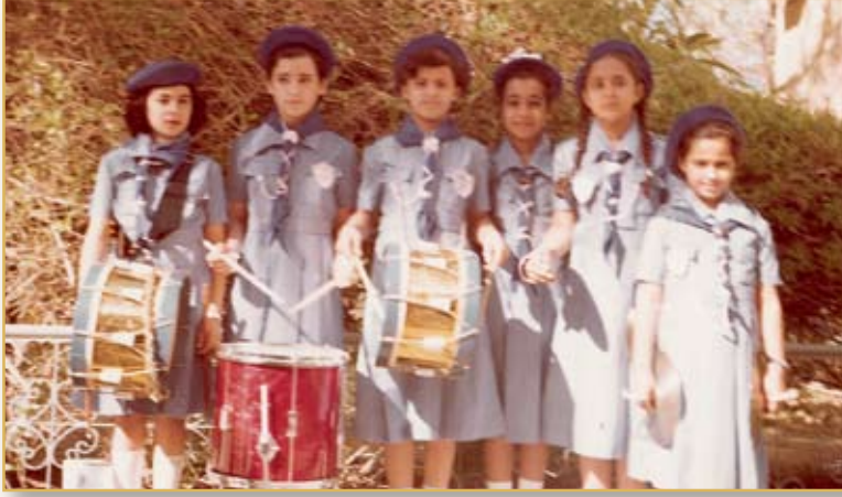
فرقة الكشافة الموسيقية

وهكذا كان إرساء مفهوم العمل التطوعي أساسياً لتدرك الفتاة أن واجبها بالتطوع لخدمة مجتمعها الكبير حتماً وليس اختيارياً، كما اعتادت على أن تخدم مجتمعها الصغير في المدرسة.