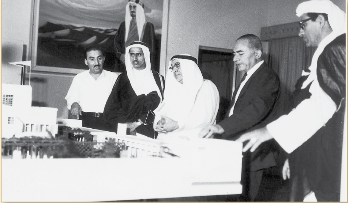
عرض مجسم مبنى طريق الميناء ١٩٦٧م

فمنهن من تجاوزت، ومنهن من غادرت، وقد تسبب ذلك في عجز لم يتثنى عن قراري، ولم يضعف حجتي؛ لأنني ببساطة أدرك بأن المعلمات هن في الأساس خريجات مدارس عربية اعتدن فيها على البرامج التعليمية المتطورة، ولم يكن من الممكن أن أقبل بتخاذلهن عن أداء مهمتهن في (دار الحنان) على أكمل وجه».