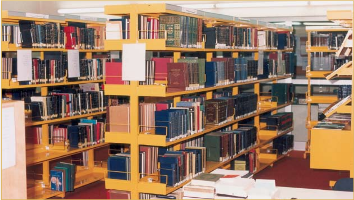
مكتبة القسم المتوسط والثانوي