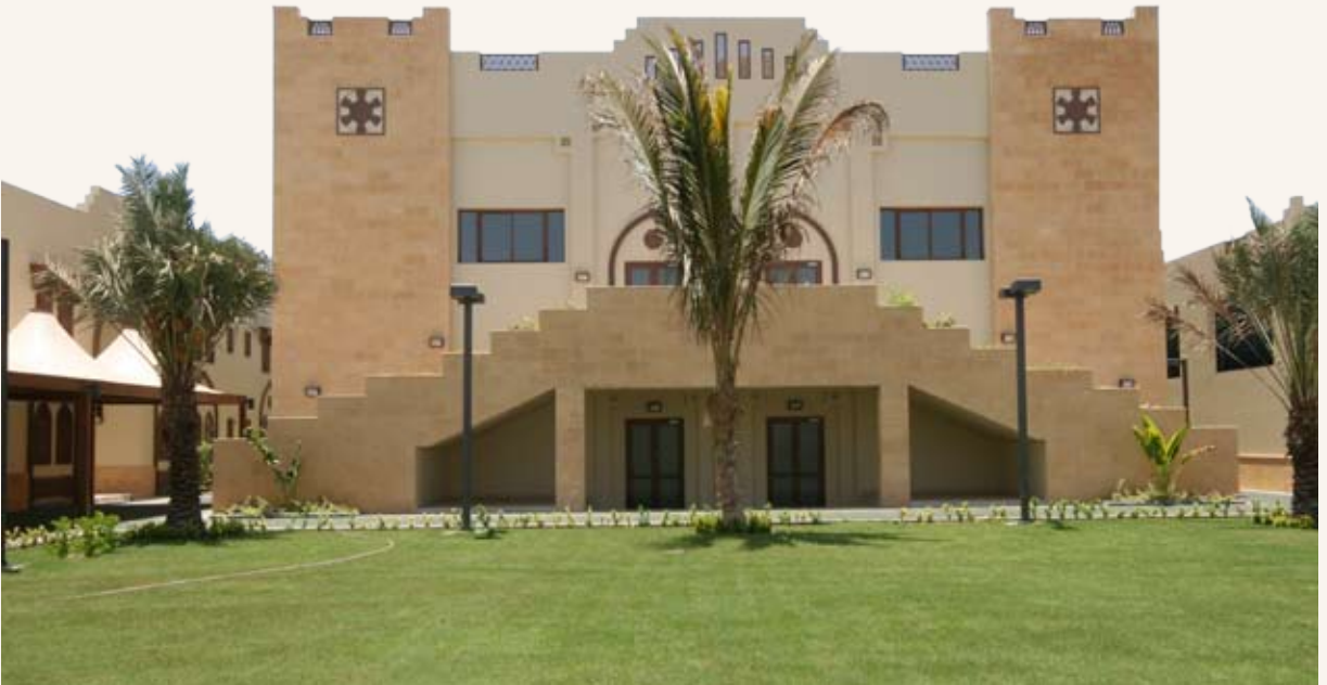
مبنى حي الزهراء