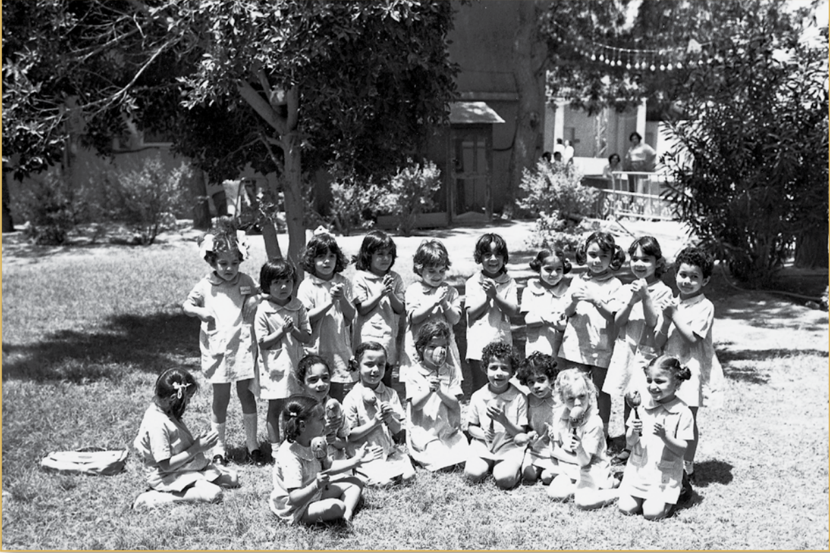
المرحلة التحضيرية ١٣٩٩هـ

قريبة ليست ببعيدة عن مدرستها، كانت الأميرة عفت توجّه وتحرص على تتبع خطوات بناتها بعد تخرجهن، وتوضح ذلك السيدة سيسيل، بقولها: