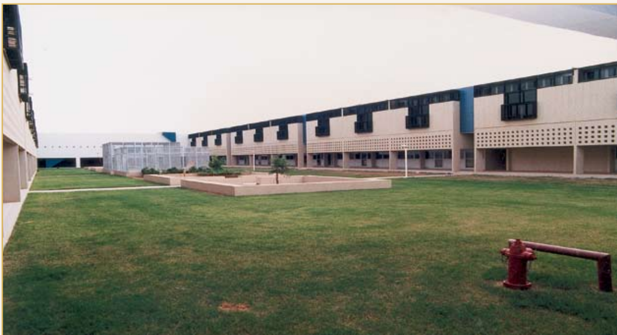
مساحات خضراء تتوسطها أحواض للزراعة وأقفاص لتربية الحيوانات والطيور التي تقوم بالإشراف عليها جمعيات المرحلة المتوسطة والثانوية، ويظهر إلى اليمين مبنى القسم المتوسط والثانوي وإلى اليسار مبنى القسم الابتدائي