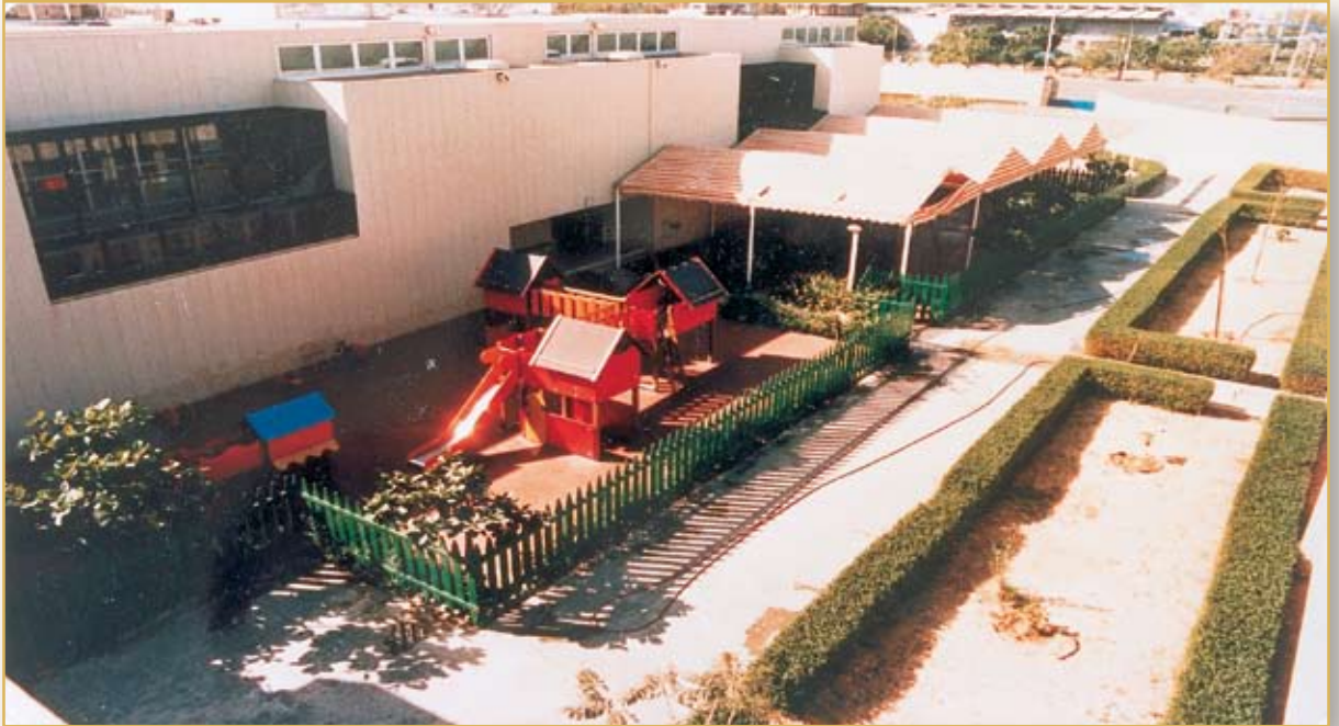
مدينة مصفرة تابعة لمبنى المرحلة التحضيرية وكان يجري تغيير مجسماتها لأغراض تعليمية