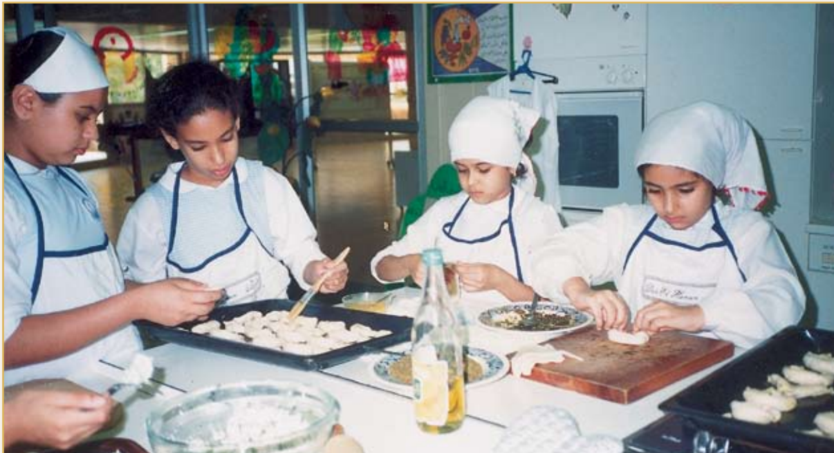
حصّة تدبير منزلي