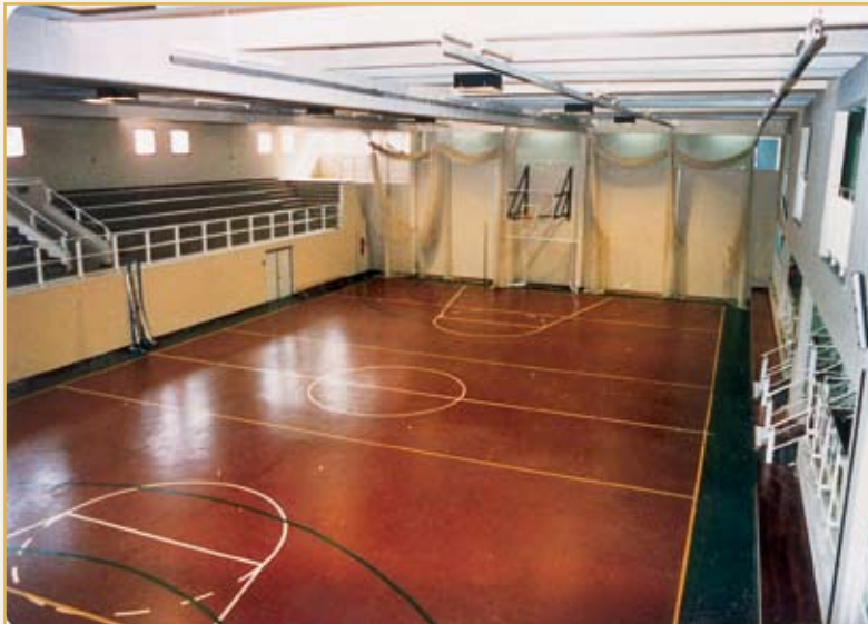
ملعب كرة السلة