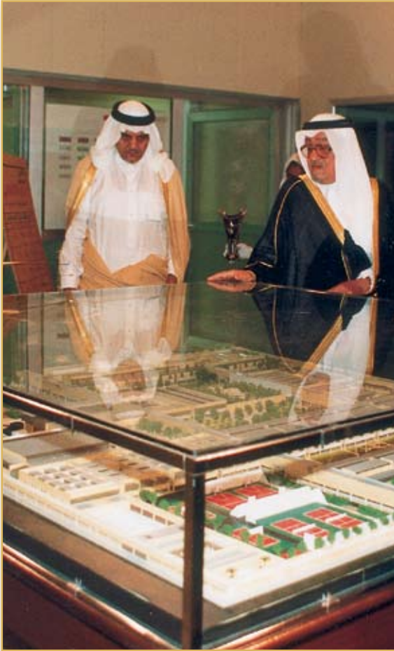
الأمير عبد الله الفيصل - يرحمه الله - والأمير محمد الفيصل أمام مجسم المدرسة في مبنى الإدارة العامة