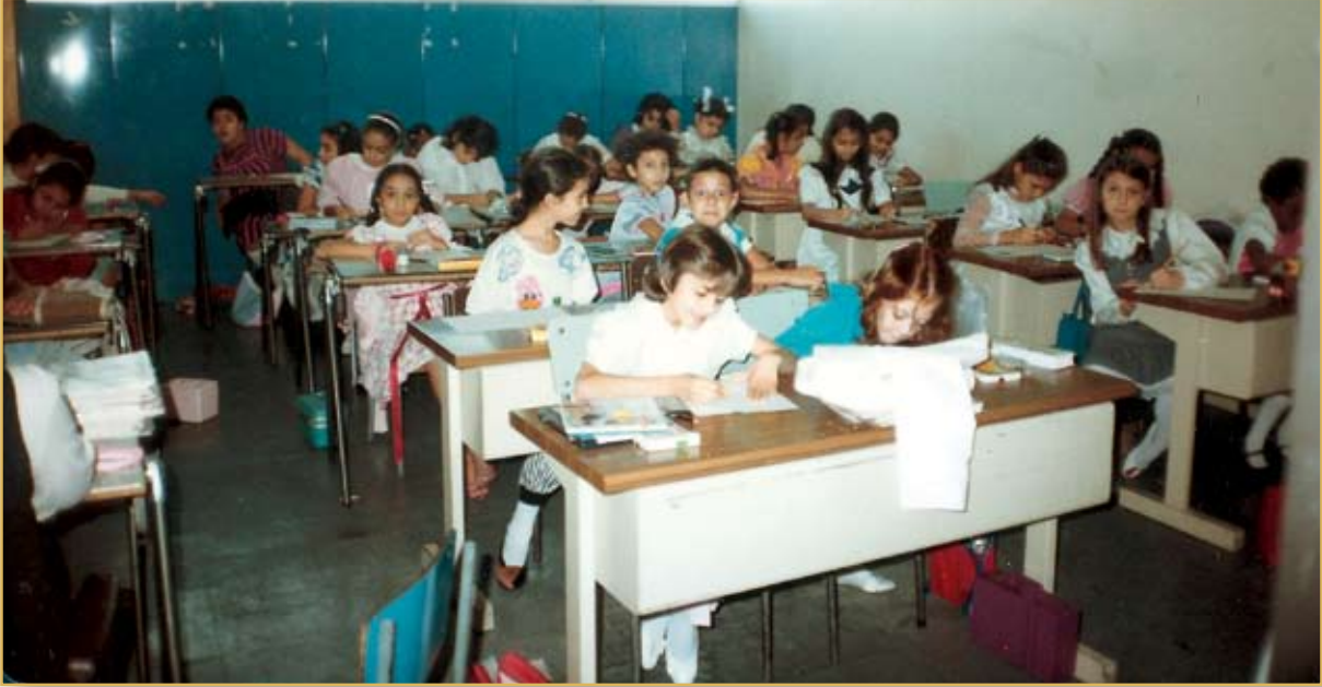
اليوم المفتوح في أحد فصول المرحلة الابتدائية بمبنى مطار جدة القديم

بكرة الخياطة، وبحثت عنها فلم تجدها حتى أحضرتها لها زميلتها في الحجرة المجاورة، وأخبرتها أنها وجدها تتدحرج في حجرتها. في اليوم التالي حضرت المعلمتان إلى مكتبي ترويان لي القصة ضاحكتين، فسألتهما كيف؟! كيف تتدحرج البكرة في حجرة فتصل إلى الحجرة الثانية؟!... توقفنا عن الضحك لأن الإجابة تبدو واضحة، فببساطة إن الأرض، أو سقف الدور السفلي قد هبط، وأصبحت هناك فجوة بين الحائط والأرض تدحرجت من خلالها البكرة ووصلت إلى الحجرة الأخرى... وتضيف: «ذهبت مباشرة إلى الحجرة التي وقعت فيها تلك الحادثة، واستدعيت لجنة من المهندسين الذين أفادوا بأن المبنى (آيل للسقوط)، ولا بد من إخلاء هذا الطابق. كنا - آنذاك - في منتصف العام الدراسي مقبلات على الامتحانات النصفية، وعلينا أن نتخذ قراراً سريعاً».