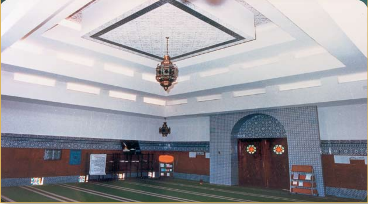
المسجد من الداخل