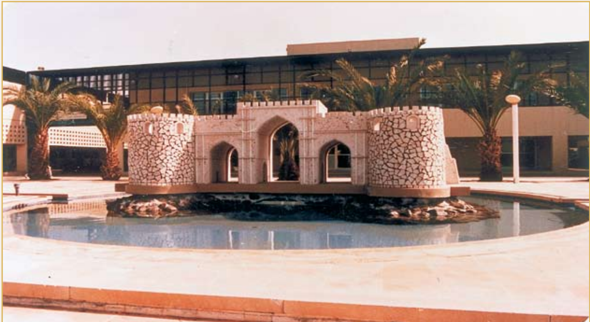
مجسم بوابة جديدة أمام مبنى الإدارة العامة

بينما كنا نراه - نحن الطالبات - (مدينة دار الحنان)، نساغر إليها كل يوم لنعيش فيها حياة متكاملة بكل صورتها التي ينشدها الإنسان من تعليم، وثقافة، وعمل، وتعارف، وتواصل اجتماعي، وتجارب جديدة، واكتشافات، ومساحات شاسعة، ومناظر طبيعية خلابة، ومرافق، وترفيه.