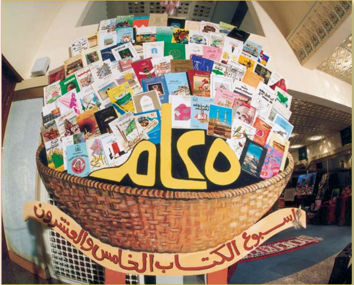
سلة أبحاث طالبات دار الحنان في أسبوع الكتاب الخامس والعشرون

كيف عالجت (دار الحنان) هذه المشكلة لتصل الطالبة إلى استيعاب أهمية الكتاب ويتجاوز مفهومه لديها الدراسة إلى دوره في تشكيل الثقافة؟