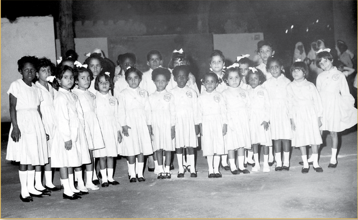
طالبات دار الرعاية ١٣٨٣هـ / ١٩٦٣م

وفي عام ١٣٨٠هـ - ١٩٦٠م عانقت (دار الحنان) فرحة خريجاتها اللاتي حصلن على الشهادة الابتدائية، فيما حصلت المدرسة على شهادة سجلها التاريخ، فكانت أول مدرسة أهلية تتخرج منها الفتاة السعودية حاملة للشهادة الابتدائية وفقاً لمناهج وزارة المعارف. وقد تزامن ذلك الحدث مع نقلة هامة في مسيرة تعليم البنات، حيث أصدر الملك سعود بن عبدالعزيز - طيب الله ثراه - مرسوماً ملكياً يقضي بتشكيل «الرئاسة العامة لتعليم البنات» لتكون هيئة حكومية رسمية ترتبط بها مدارس البنات في جميع أنحاء المملكة ابتداءً من عام ١٣٨٠-١٣٨١هـ.