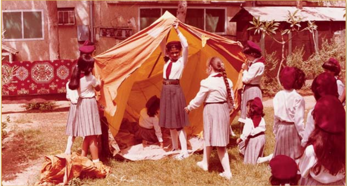
معسكر داخل المدرسة

وتضيف: «لم تكن الرحلة الأخيرة.. فبعدها ذهبنا إلى مخيم في دولة الكويت، وآخر في سويسرا، وكان برنامج الرحلة يتضمن رحلات داخلية، ومباريات رياضية، وزيارة للمتاحف، وتسلق الجبال. ولعل أهم استفادة حصلنا عليها من تلك التجارب هي الاعتماد على النفس، والعمل الجماعي بالإضافة للتعود على صلاة الجماعة.»