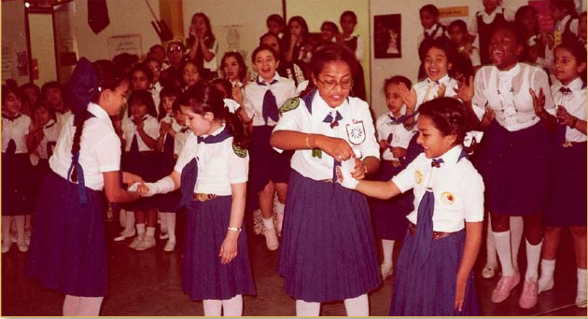
مسابقة إسعافات أولية

المرشدات الموسيقية لتتبعها في مكان نقوم بزيارته للمرة الأولى، ومع ذلك نبدو وكأننا نحفظ الطريق لموقعنا فيه عن ظهر قلب.