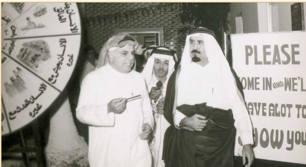
صاحب السمو الملكي الأمير ماجد بن عبدالعزيز يرحمه الله يفتتح أحد معارض دار الحنان