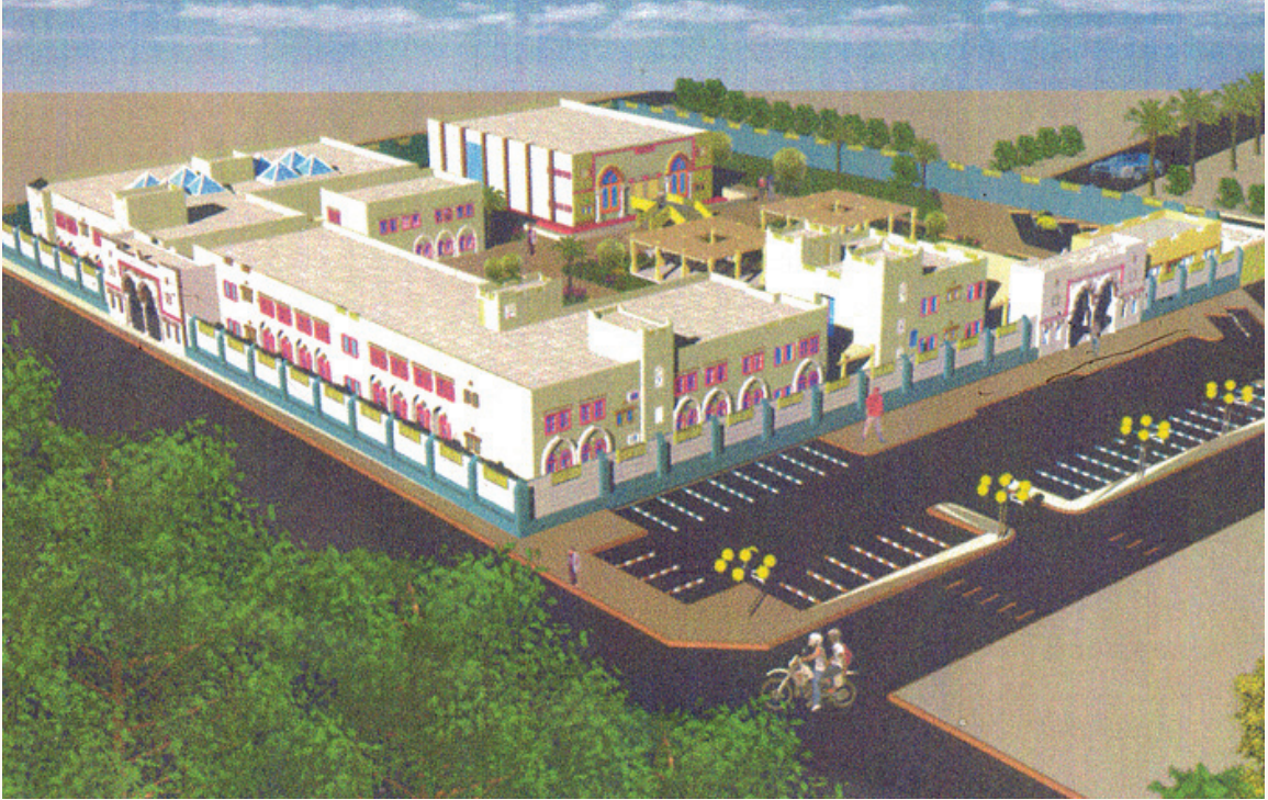
مجمع مدارس دار الحنان الجديد