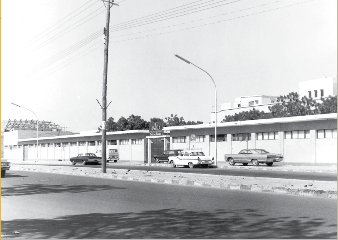
صورة مبنى المدارس طريق الميناء