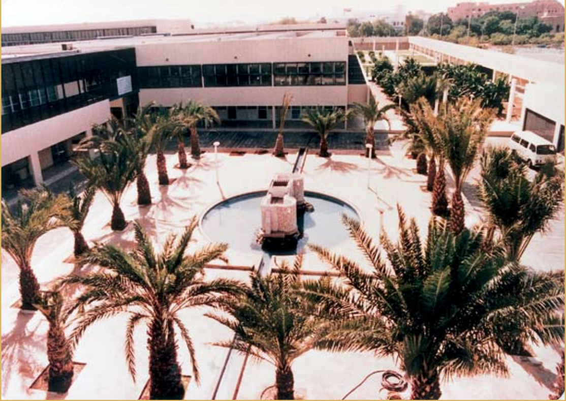
صورة لمبنى المدرسة بجوار قصر خزام