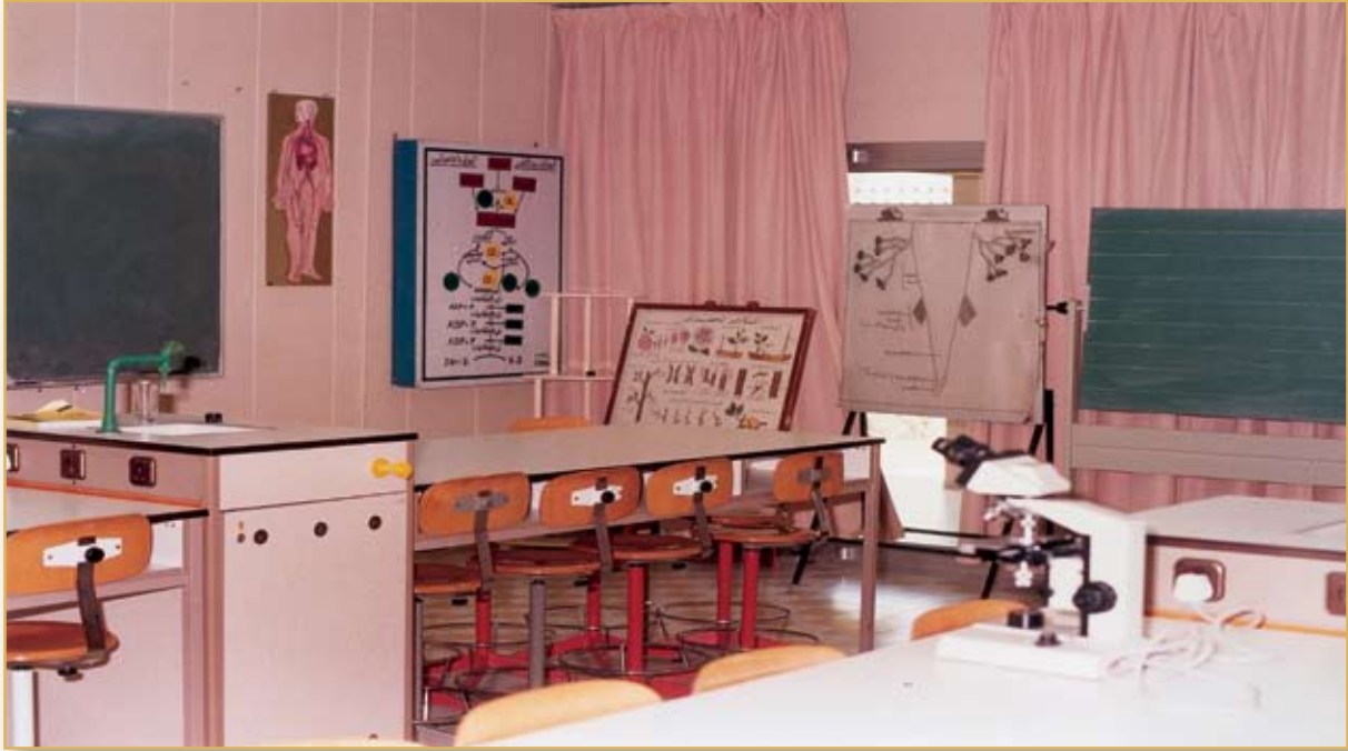
معمل الأحياء في القسم المتوسط والثانوي

معامل الكيمياء، ثم الفيزياء مزوّدة بأحدث الأجهزة والأدوات المطلوبة لإجراء التجارب، ومعرفة النتائج، وتطبيق القوانين العلمية .