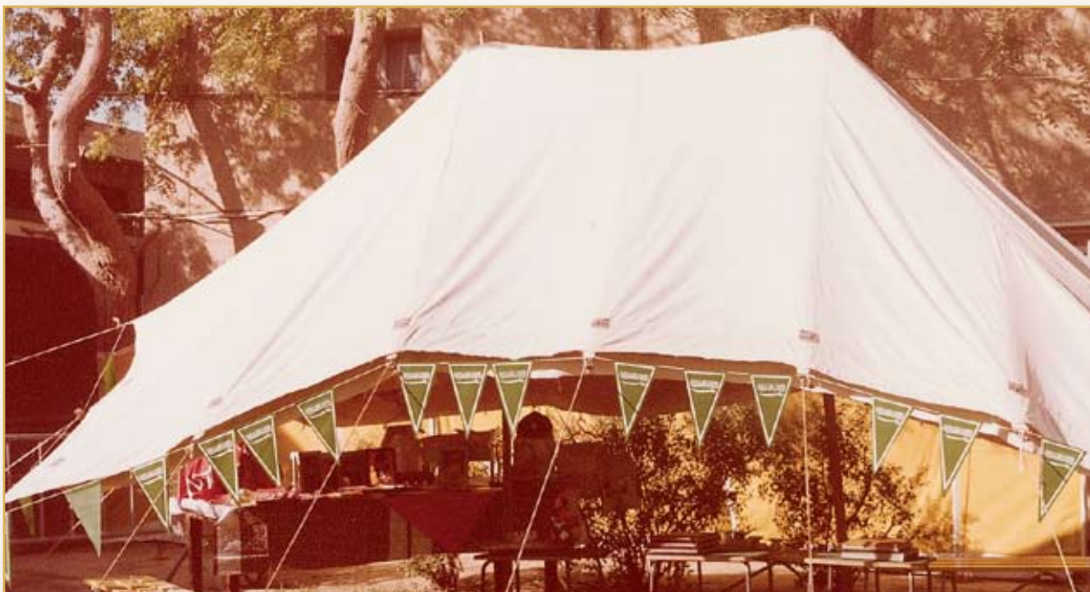
معسكر الكشافة في دار الجنان