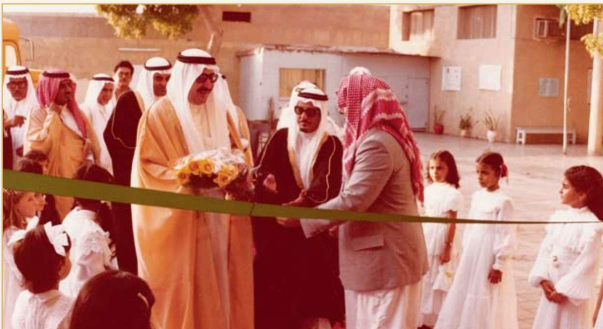
صاحب السمو الملكي الأمير فواز بن عبدالعزيز يفتتح معرض دار الحنان ١٣٩٤هـ/ ١٩٧٣م