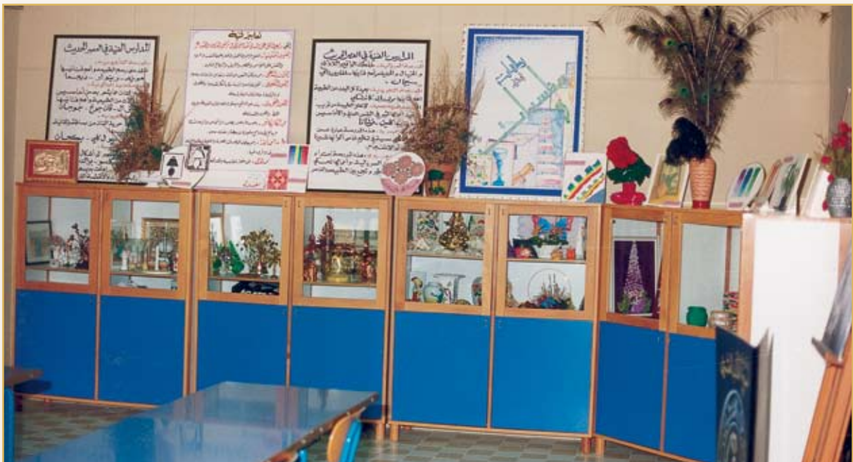
قاعة الحرف اليدوية